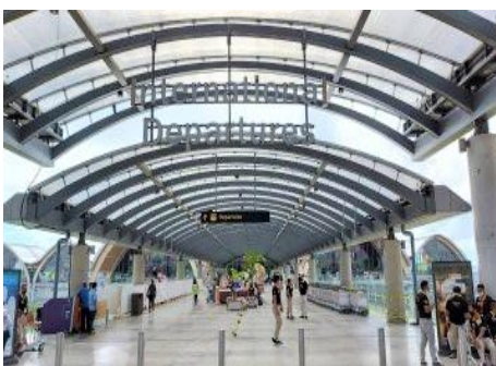
《復旧が進んでいるマクタン・セブ国際空港》

又、マクタン・セブ国際空港では台風被害からの復旧工事のため 現在、国際線・国内線共に出発はターミナル2に集約されている。車両の降車場所からターミナル2へ続く通路などでは売店の営業が徐々に再開されてきており、わずかながら久しぶりの賑わいを見せている。