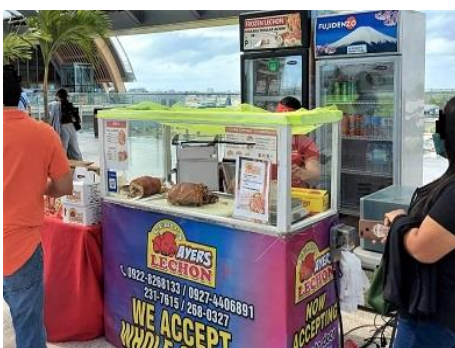
《再開した店舗 / マクタン・セブ国際空港》